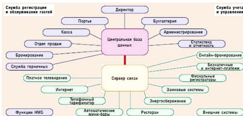
Рис. Схема взаимосвязей гостиницы, осуществляемых с помощью АСУ

2. По опросам участников гостиничного рынка сделать краткие выводы