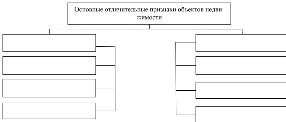
Рис. Основные отличительные признаки объектов недвижимости

27. Задание 2. Объясните, в каких случаях ценность всех объектов недвижимости на территории города может быть примерно одинаковой.